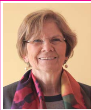
Maryse AUGENDRE - Maire de Coulanges-lès-Nevers

“ La rédaction d’un guide pratique s’est vite imposée aux nouveaux élus, soucieux d’apporter les informations dont les Coulangeois ont besoin quotidiennement, ainsi qu’aux nouveaux arrivants qui découvrent notre « belle ville à la campagne ».